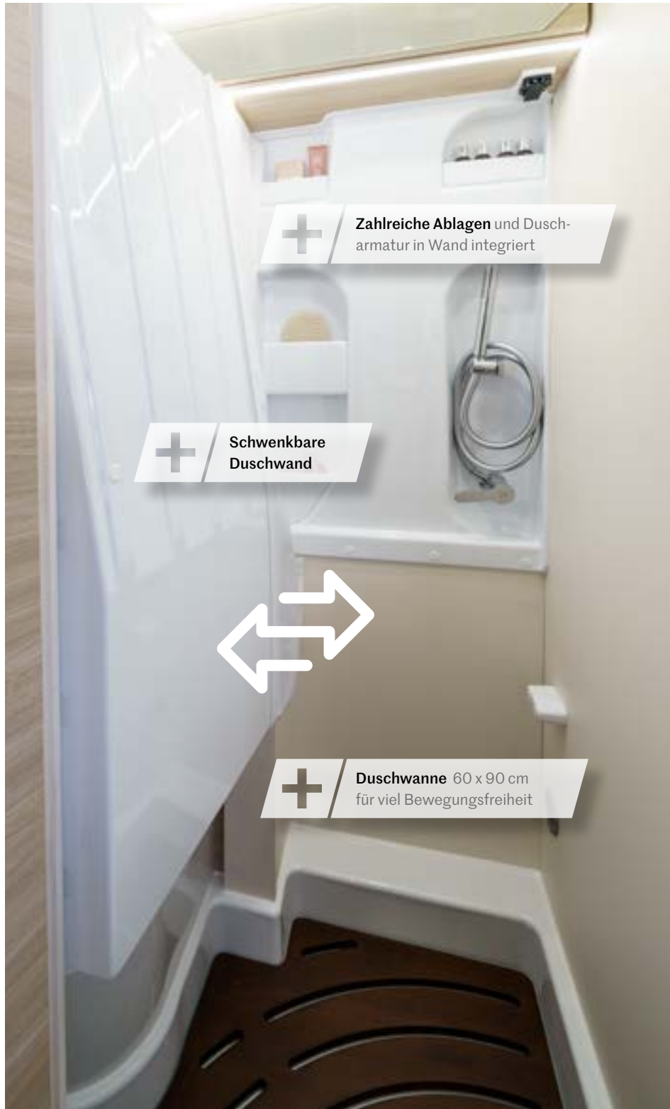
+ Zahlreiche Ablagen und Duscharmatur in Wand integriert