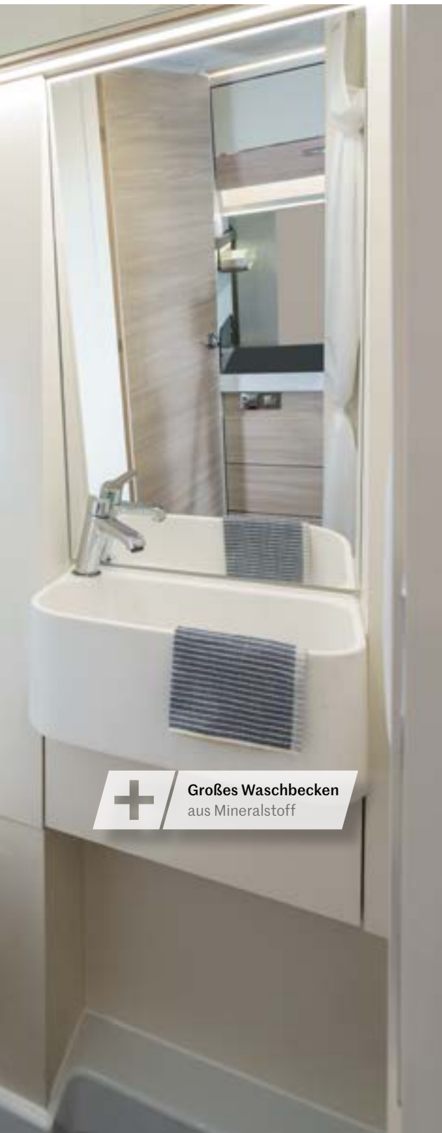
+ Großes Waschbecken aus Mineralstoff