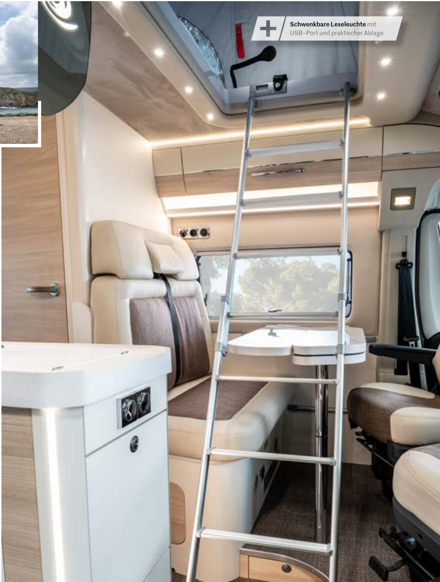
+ Schwenkbare Leseleuchte mit USB-Port und praktischer Ablage