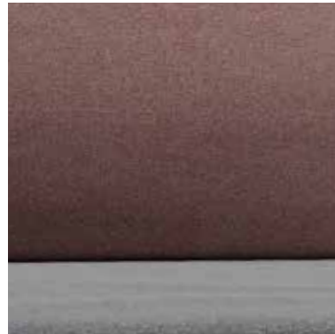
MAUVE DAMASK OPTION