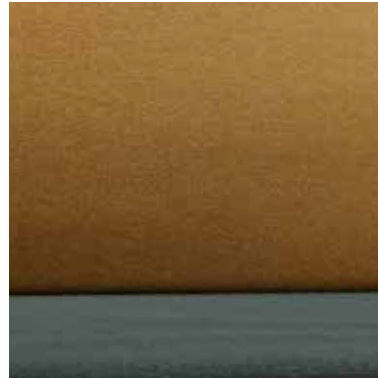
DAFFODIL DOBBY SERIE