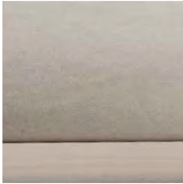
TOFFEE TWEEED OPTION