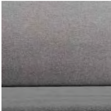
SILVER ASH OPTION